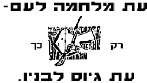
Görsel 2: Etzel'in Halkı Savaşa Çağırın Broşürü