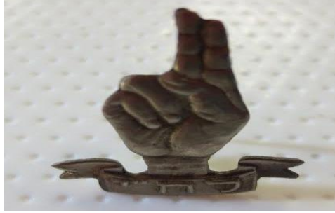
Görsel 3: Lehi Sembolü